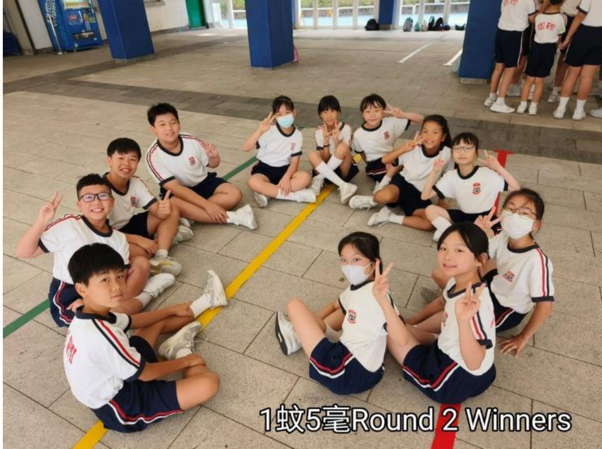
1蚊5毫Round 2 Winners