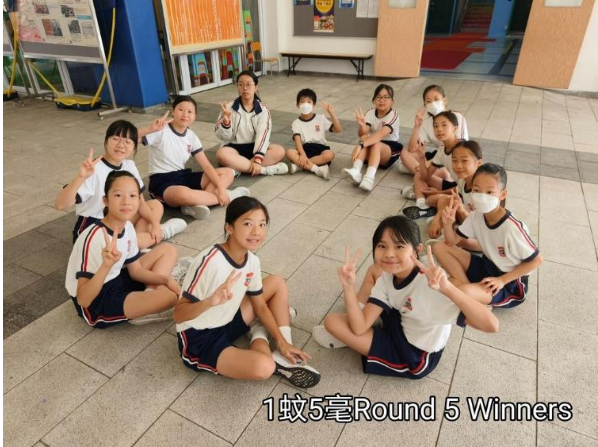
1蚊5毫Round 5 Winners