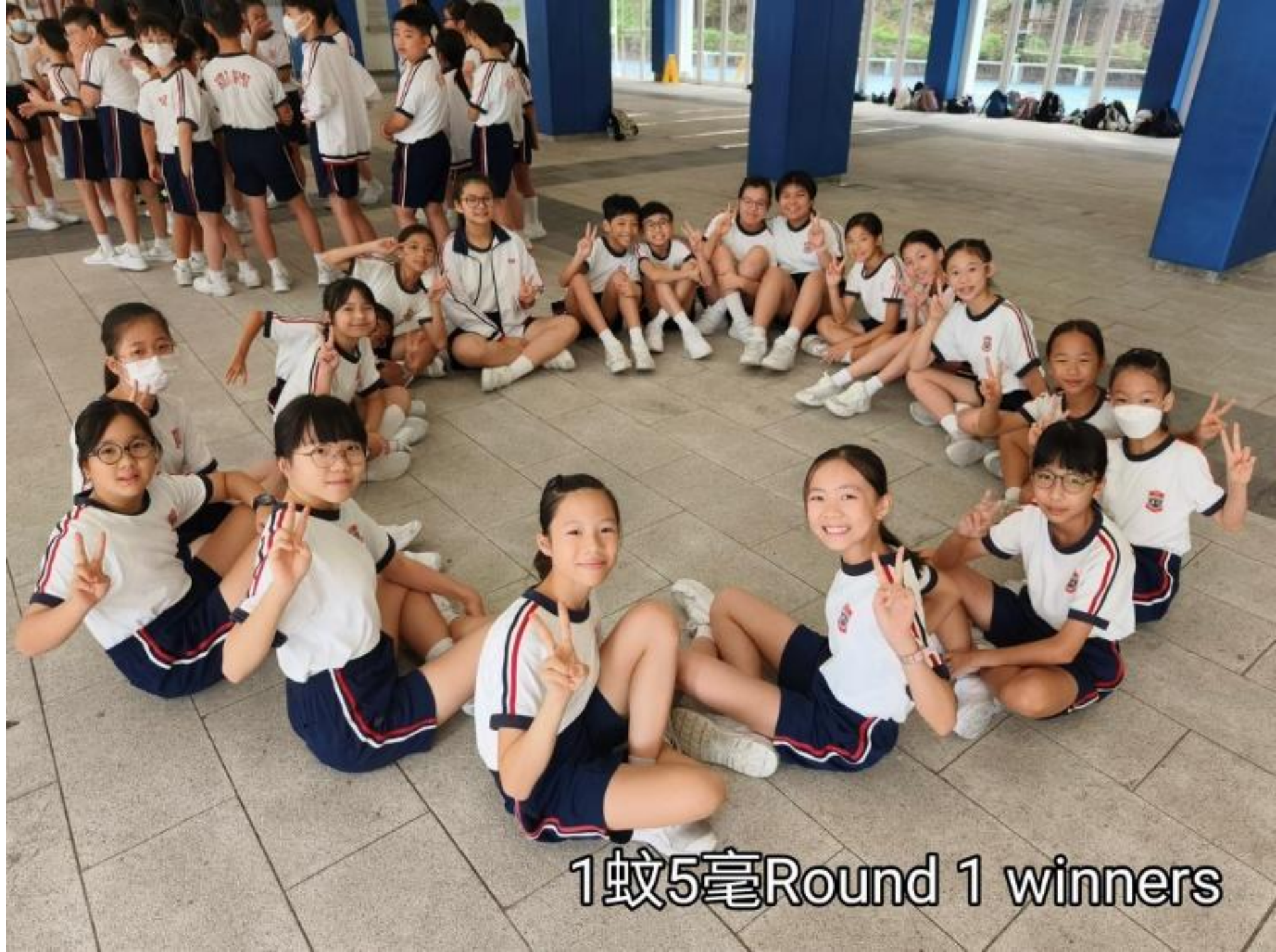
1蚊5毫Round 1 winners