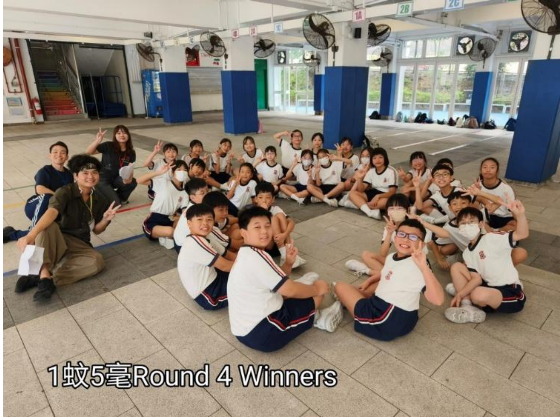
1蚊5毫Round 4 Winners